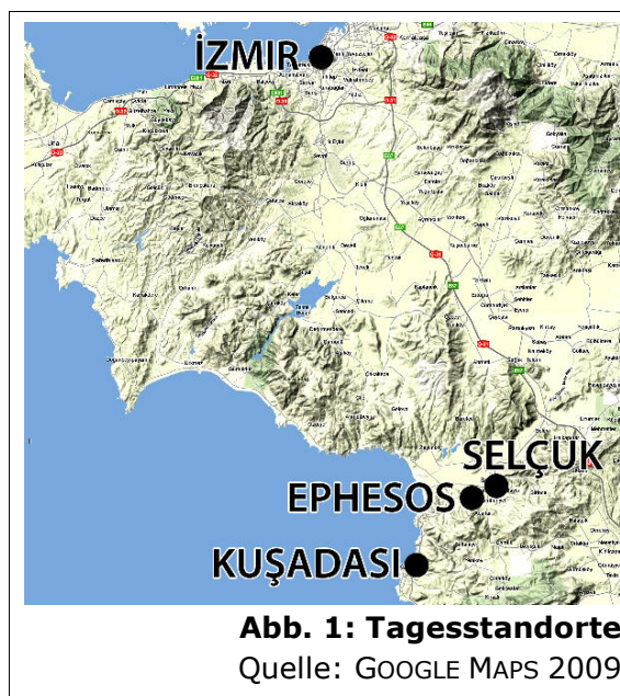
Abb. 1: Tagesstandorte

In diesem Protokoll sollen die wichtigsten Fakten zu den Exkursionsstandorten İzmir, Selçuk, Ephesos und Kuşadası festgehalten werden. Zudem wird das in Ephesos gehaltene Referat „Ephesos und die Besiedlung Kleinasiens“ in knapp ausgearbeiteter Textform in das Protokoll integriert. Im nun folgenden Kapitel wird eine allgemeine Einführung zur Siedlungsgeschichte Westanatoliens gegeben.