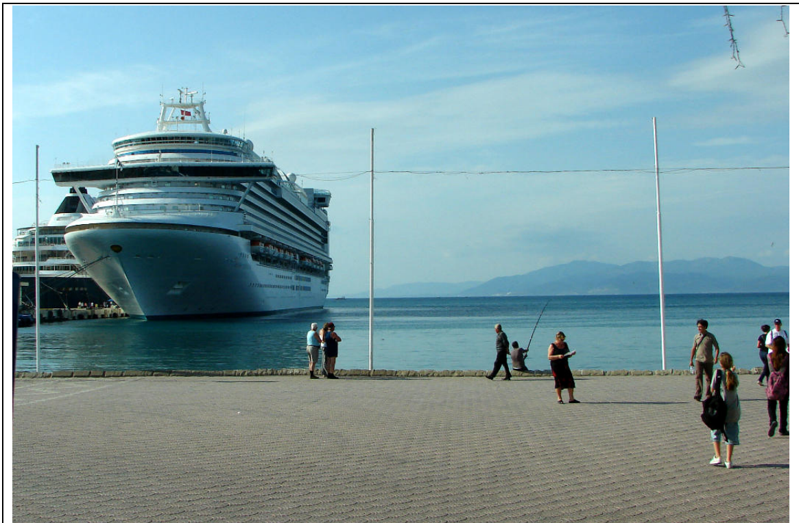
Abb. 5: Die „Ruby Princess“ im Hafen von Kuşadası. Am Vortag lag dieser Luxusliner noch in Istanbul vor Anker.

Speziell für Kreuzfahrttouristen ist Kuşadası ein wichtiges Ziel. Zwischen 600 und 800 Passagierschiffe steuern den Hafen jährlich an (vgl. ebd.). Er bildet für die Reisenden den Ausgangspunkt für ihren Ephesos-Landgang, der fester Bestandteil vieler Kreuzfahrtrouten durch den östlichen Mittelmeerraum ist. Vom Schiffsanleger fahren bis zu 50 Busse täglich ab, um die Touristen in die antike Stadt zu befördern. Die Schiffe kommen häufig direkt aus Istanbul und liegen in Kuşadası für eine Nacht vor Anker, um dann in südlicher Richtung weiterzufahren – oder umgekehrt (s. Abb. 5).