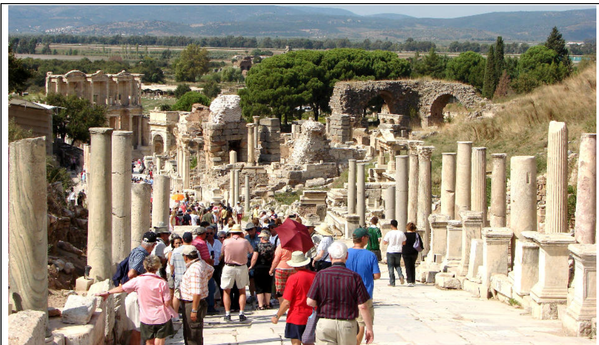
Abb. 3: Massenattraktion Ephesos. 1,8 Mio. Touristen pro Jahr besuchen die weltbekannte antike Metropole. Diese Aufnahme zeigt im Hintergrund die Celsusbibliothek, die Anfang des 2. Jh. in römischer Zeit gebaut wurde. Zu ihr führt die Kuretenstraße, eine ehemalige Hauptverkehrsachse, die wegen ihres hohen Alters dem Hippodamischen System nicht entspricht.

Als im 3. Jh. der soziale und wirtschaftliche Niedergang des Römischen Reiches begann, geriet auch Ephesos in die Krise. Ab dieser Zeit entstanden hier fast keine Großbauten mehr. Erschwerend hinzu kam die Verlandung des Hafens, die die Stadt zunehmend vom Meer abschchnitt und damit isolierte. Im Jahr 262 wurden große Teile der Stadt durch ein schweres Erdbeben beschädigt und nicht wieder aufgebaut, etwa die Hanghäuser und die Celsusbibliothek (s. Abb. 3).